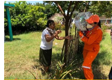
Entrega de despensas, Respuesta al Covid-19, 2020.

Esas medidas se aplicaron siguiendo los mismos criterios de los proyectos de desarrollo local.