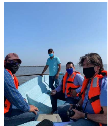
Visita a las lagunas. Proyecto Piloto de Ostiones. Mizamtec-UJAT, 2020.

En el 2021, la UJAT llevará a cabo una actualización del estudio de los impactos del Proyecto en AC1 sobre las actividades pesqueras, considerando la instalación de la nueva Plataforma y la llegada de la Unidad FPSO (fase de plena producción). También participará como implementador del proyecto piloto de cultivo de ostiones utilizando canastas australianas y seguirá realizando la vigilancia semestral de la laguna y los diagnósticos ambientales.