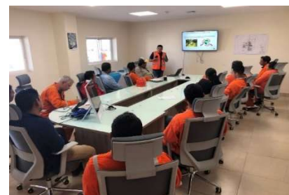
Entrenamiento de inducción para los empleados de los contratistas en la ORF, 2020.

Adicionalmente, el Departamento de Sustentabilidad comenzó a impartir capacitaciones de inducción a los empleados de los contratistas, incluyendo temas relacionados con las buenas prácticas de comportamiento. Hasta febrero de 2020, más de 140 empleados de las contratistas registraron su asistencia. Entre los contratistas que participaron en estas capacitaciones se encontraron contratistas de seguridad, con 14 participantes registrados. Dada la pandemia del Covid-19, estas capacitaciones fueron pospuestas.