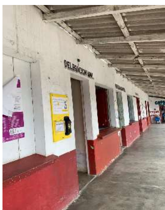
Buzones en la Delegación Municipal de Sánchez Magallanes, 2020.

AC17. Implementar un mecanismo comunitario de quejas. El mecanismo comunitario de atención a quejas de Eni México ya está implementado y operando. Ofrece cuatro canales de comunicación que incluye la comunicación por teléfono, correo electrónico, buzones y en persona. Los buzones