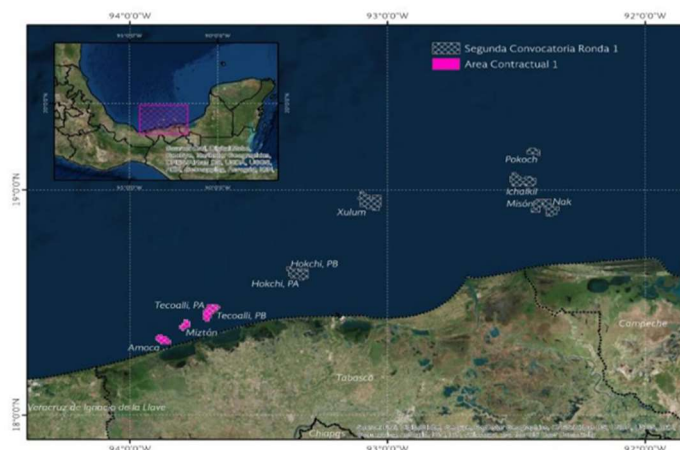
Figura 1. Área Contractual 1

Fuente: Sitio web Rondas México, Administración de Contrato (CNH-R01-L02-AC1/2015), Sección Datos Generales: Resultados de la Licitación 1