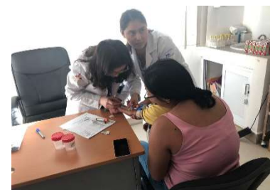
Toma de laboratorios, Proyecto de Nutrición, 2020.