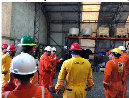
Auditoría Social a Rediesa en la base de Logística de Eni, 2019.

A21. Diseñar y llevar a cabo auditoría(s) social(es) de cada contratista y subcontratista que trabaje en el Proyecto (al menos una vez al año). En 2019 y 2020, el Departamento de Sustentabilidad llevó a cabo, conjuntamente con el Departamento de HSE, tres auditorías sociales. La primera abarcó