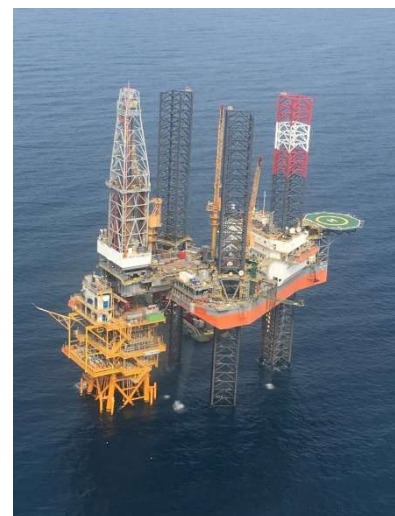
Plataforma en el campo Miztón, 2019.

En 2019, Mizamtec Operating Company S. de RL de CV fue creada como parte de Grupo Empresarial Eni, a través de la cual Eni México lleva a cabo sus actividades de exploración y producción.