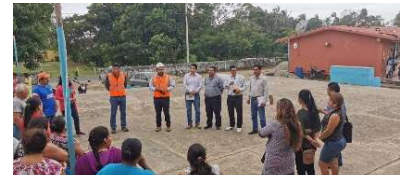
Reunión sobre el Proyecto de Educación en una comunidad local (Paylebot), 2019.

AC14. Definir e implementar la estrategia de comunicación y participación con las comunidades, teniendo en cuenta las necesidades de información y consulta sobre las actividades del proyecto y sus repercusiones, y teniendo debidamente en cuenta los grupos vulnerables (mujeres, etc.). Se celebran periódicamente reuniones y sesiones informativas con las comunidades locales, que abarcan principalmente temas de inversión social (educación y salud). Durante 2019 y 2020 se celebraron más de 40 reuniones con