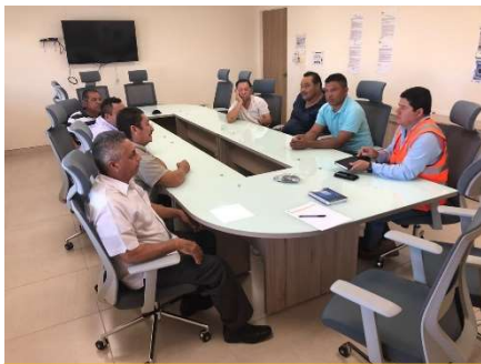
Reunión con líderes de pescadores en la ORF, 2019.

A9. Desarrollo de alternativas sustentables y a largo plazo para los pescadores. Con el fin de promover el desarrollo sustentable, Eni México está explorando alternativas para el sector pesquero, las cuales abarquen medidas que vayan más allá de las compensaciones con gasolina. La definición de proyectos de desarrollo local destinados a diversificar la actividad pesquera y a promover una gestión pesquera segura, eficiente y sustentable es una de esas alternativas. Lo anterior basado en principios, directrices y normas internacionales pertinentes sobre la pesca, en estudios de viabilidad y en la retroalimentación de las comunidades pesqueras a través de foros comunitarios, sesiones informativas y otros mecanismos definidos en el Plan de Vinculación con GI. Algunos proyectos que serán implementados en 2021 incluyen un proyecto piloto para el cultivo sustentable de ostiones y un proyecto piloto para la instalación de arrecifes artificiales.