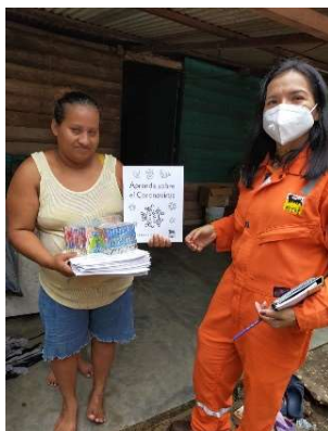
Distribución de libros para colorear sobre el Covid-19, 2020.

las comunidades locales. Sin embargo, en 2020, la mayoría de estas sesiones se redujeron debido a la pandemia del Covid-19. En su lugar, fue posible llevar a cabo una campaña de comunicación relacionada con la enfermedad del coronavirus, que incluyó la impresión y distribución de folletos, la impresión y distribución de libros para colorear (dirigidos a niños de escuela primaria), la difusión de una campaña de prevención en una emisora de radio estatal y la colocación de pancartas con información sobre las medidas de prevención. En lo que respecta a los próximos pasos, es necesario integrar en el Plan de Vinculación con GI directrices sobre la comunicación relativa a las actividades y los impactos del Proyecto de Desarrollo en AC1. En este año se inició con la definición de la divulgación de información a este respecto, así como la definición de las modalidades de divulgación. Entre ellas se encuentran el uso del sitio web eni.com, los foros informativos, entre otros.