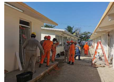
Rehabilitación de escuelas, Proyecto de Educación, 2020.